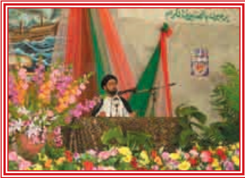
كلمة مدير مركز الدراسات في مهرجان ربيع الشهادة