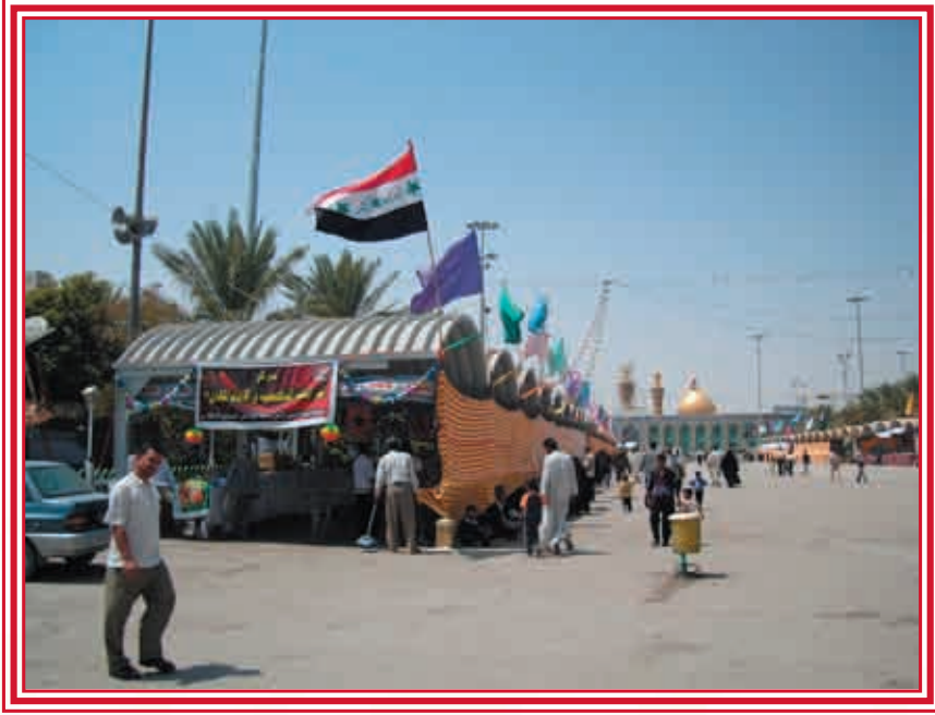
جانب من المعرض في كربلاء بين الحرمين