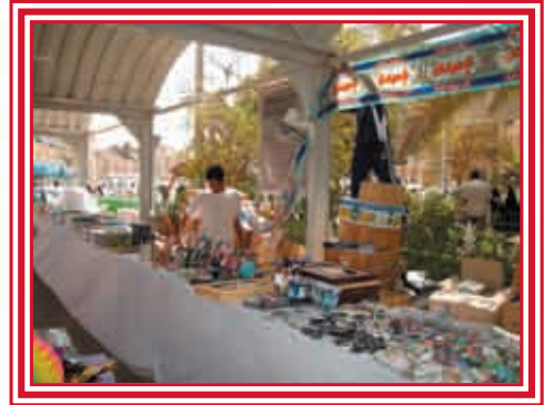
جانب من المعرض