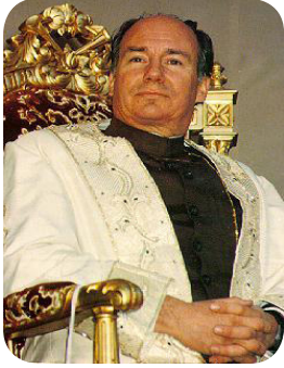
إمام الزمان الحالي للطائفة الإسماعيلية القاسمية (الأغاخانية)

إلى يومنا هذا (وهم إسماعيلية سوريا والشام وأوربا)، وآخر إمام ظاهر هو الإمام الحالي «كريم شاه الحسيني» (١) ويعتقدون بعصمته ويعيش حاليا في لندن. والغريب من معتقدات هذه الفرقة انها لا تعترف بإمامة الإمام الحسن المجتبي عليه السلام و يرون أن الإمامة انتقلت من الإمام علي عليه السلام إلى الإمام الحسين عليه السلام مباشرة.