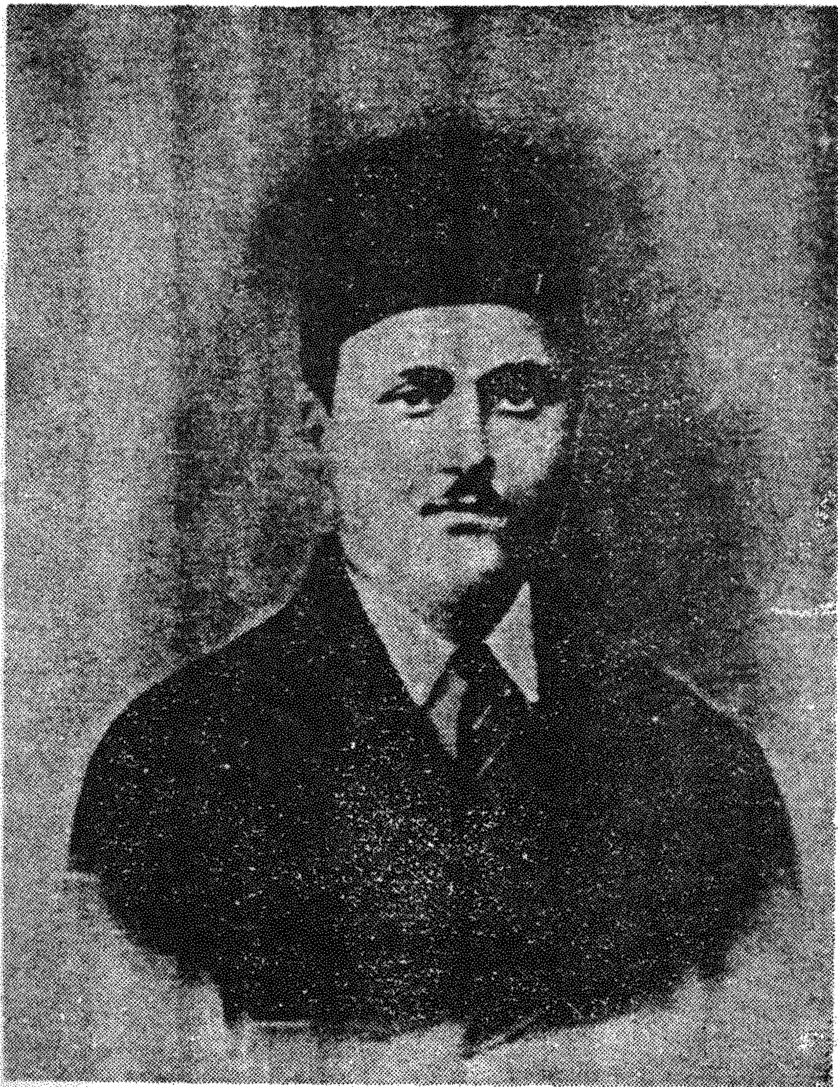
تصویری از شوقی افندی