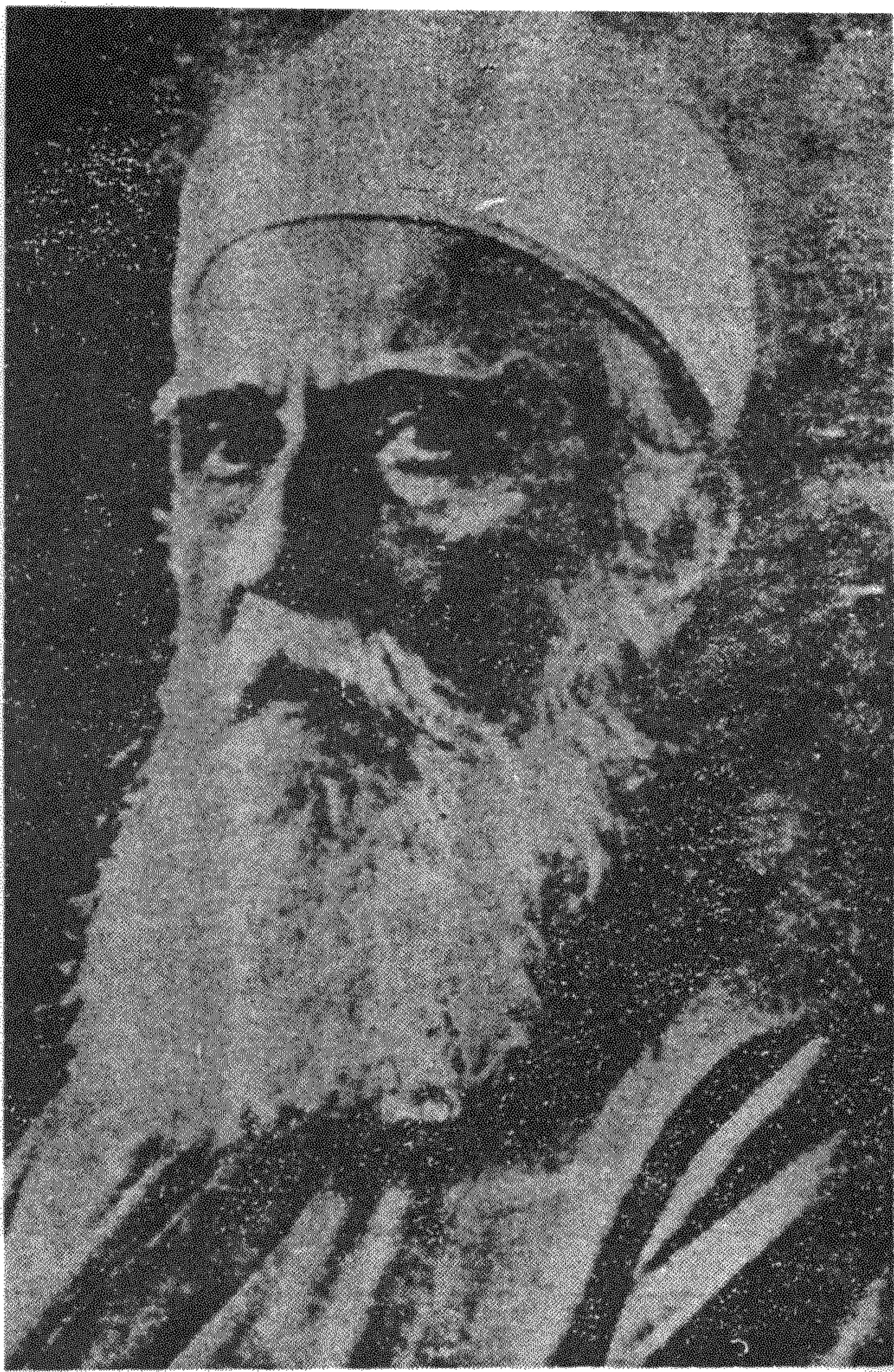
تصویری از ایام پیری عباس افندی