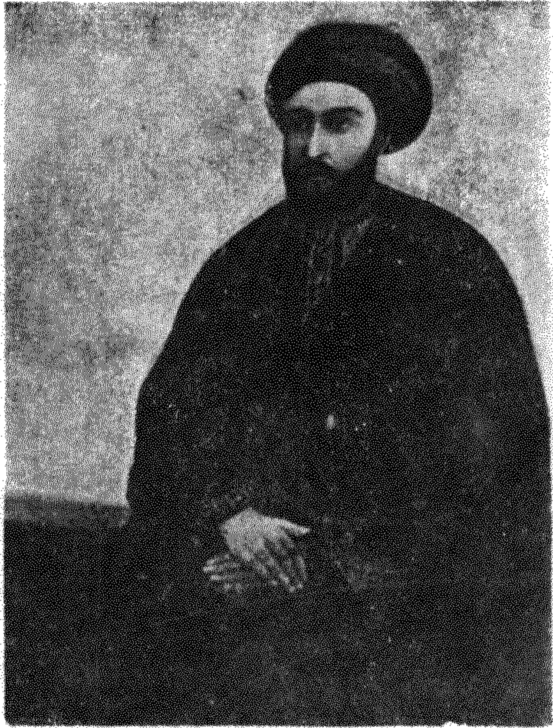
تصویری از سیدعلی محمد باب که بایمان آنرا نسبتاً اصیل و بسیار شبهه به سیدعلی محمد باب می دانند