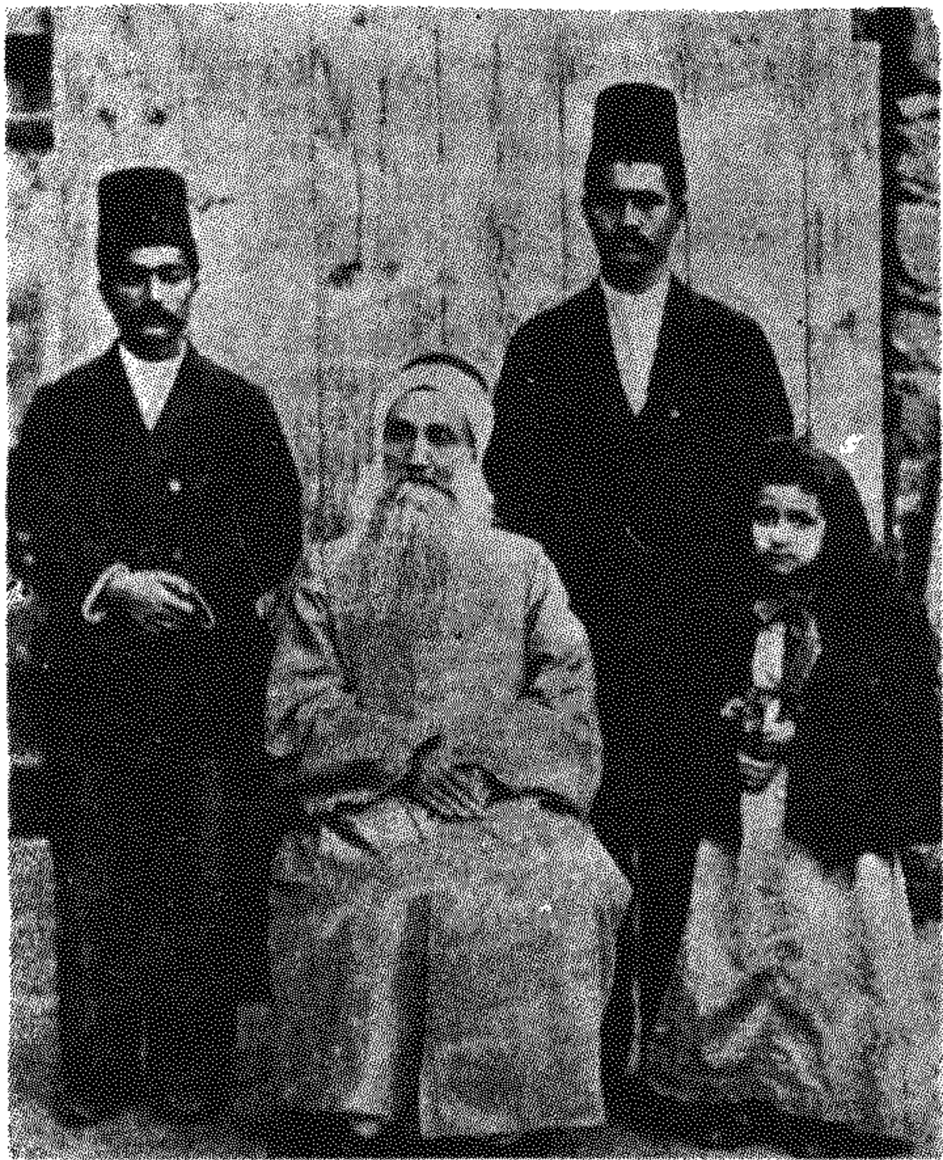
میرزا یحییٰ صبح ازل؛ مدّعی جانشینی باب